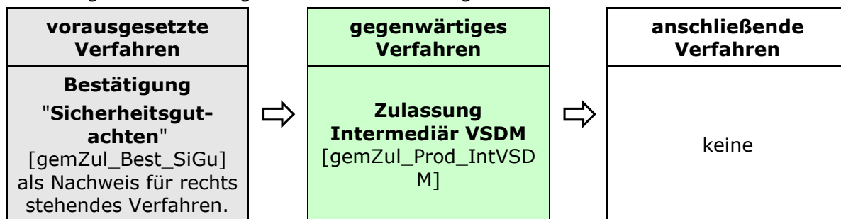
Abbildung 2: Reihenfolge Zulassungsverfahren

Das Zulassungsverfahren Intermediär VSDM steht in Abhängigkeit zu weiteren Verfahren. Die zwingende Reihenfolge bei der Durchführung ist: