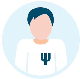
Psychotherapeutinnen und Psychotherapeuten