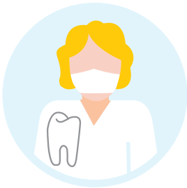
Zahnärztinnen und Zahnärzte