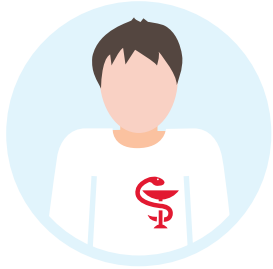
Apothekerinnen und Apotheker