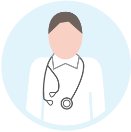
Ärztinnen und Ärzte