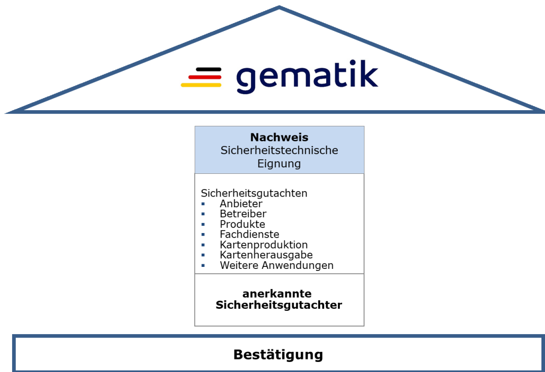
Abbildung 1: Prüfbereiche

Im Bestätigungsverfahren ist lediglich der Prüfbereich Sicherheit zu durchlaufen: