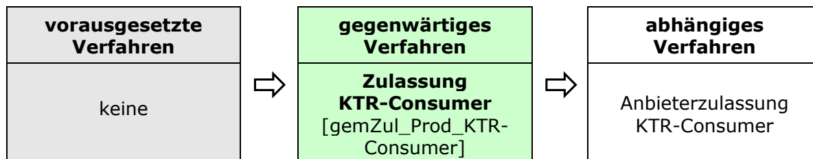
Abbildung 2: Reihenfolge Zulassungsverfahren

Das Zulassungsverfahren KTR-Consumer steht in Abhängigkeit zu weiteren Verfahren. Die zwingende Reihenfolge bei der Durchführung ist: