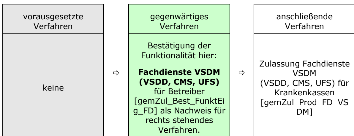
Abbildung 2: Reihenfolge Bestätigungsverfahren

Das Bestätigungsverfahren der Funktionalität Fachdienste VSDM (VSDD, CMS, UFS) für Betreiber steht in Abhängigkeit zu weiteren Verfahren. Die zwingende Reihenfolge bei der Durchführung ist: