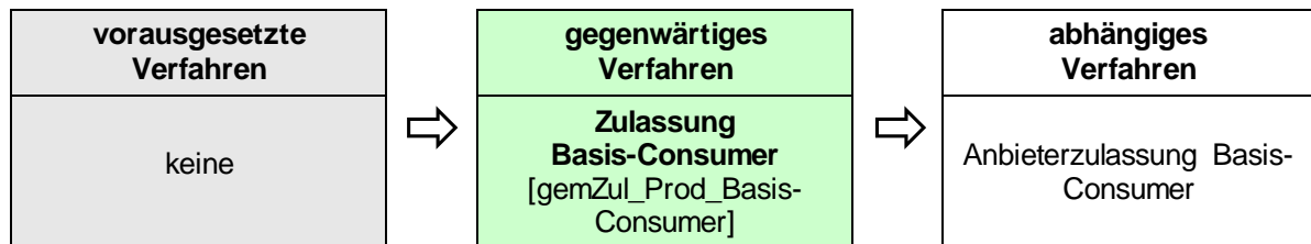
Abbildung 2: Reihenfolge Zulassungsverfahren

Das Zulassungsverfahren Basis-Consumer steht in Abhängigkeit zu weiteren Verfahren. Die zwingende Reihenfolge bei der Durchführung ist: