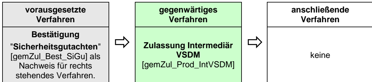
Abbildung 2: Reihenfolge Zulassungsverfahren

Das Zulassungsverfahren Intermediär VSDM steht in Abhängigkeit zu weiteren Verfahren. Die zwingende Reihenfolge bei der Durchführung ist: