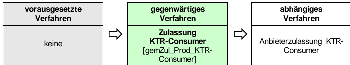
Abbildung 2: Reihenfolge Zulassungsverfahren

Das Zulassungsverfahren KTR-Consumer steht in Abhängigkeit zu weiteren Verfahren. Die zwingende Reihenfolge bei der Durchführung ist: