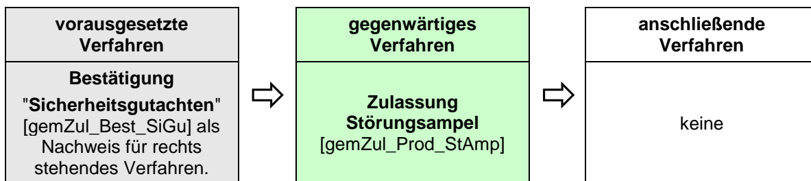
Abbildung 2: Reihenfolge Zulassungsverfahren

Das Zulassungsverfahren Störungsampel steht in Abhängigkeit zu weiteren Verfahren. Die zwingende Reihenfolge bei der Durchführung ist: