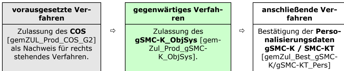
Abbildung 2: Reihenfolge Zulassungsverfahren

Das Zulassungsverfahren gSMC-K_ObjSys (Objektsystem) steht in Abhängigkeit weiterer Zulassungsverfahren. Die zwingende Reihenfolge bei der Durchführung ist: