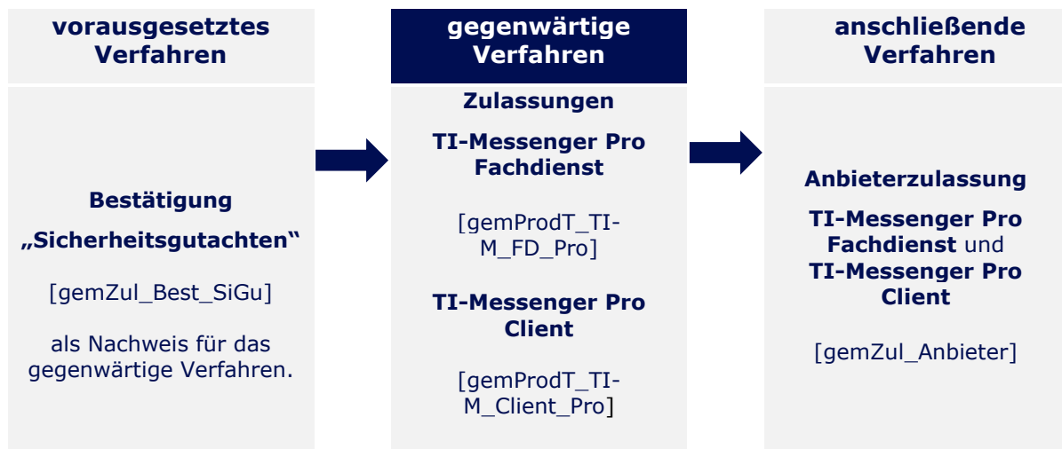
Abbildung 1: Reihenfolge Zulassungsverfahren

Die Anbieterzulassung kann parallel zur Produktzulassung beantragt und gestartet werden.